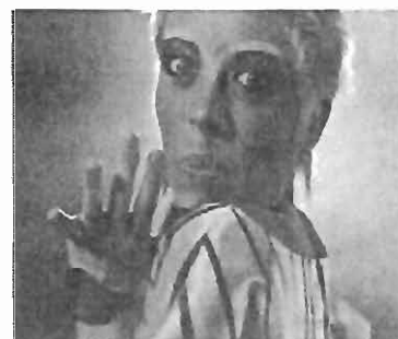
Roma, la città più "gala" d'Italia. I segreti della "voce della ..."